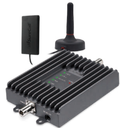
Amplificador SureCall Fusion2Go